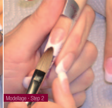
Modellage · Step 2